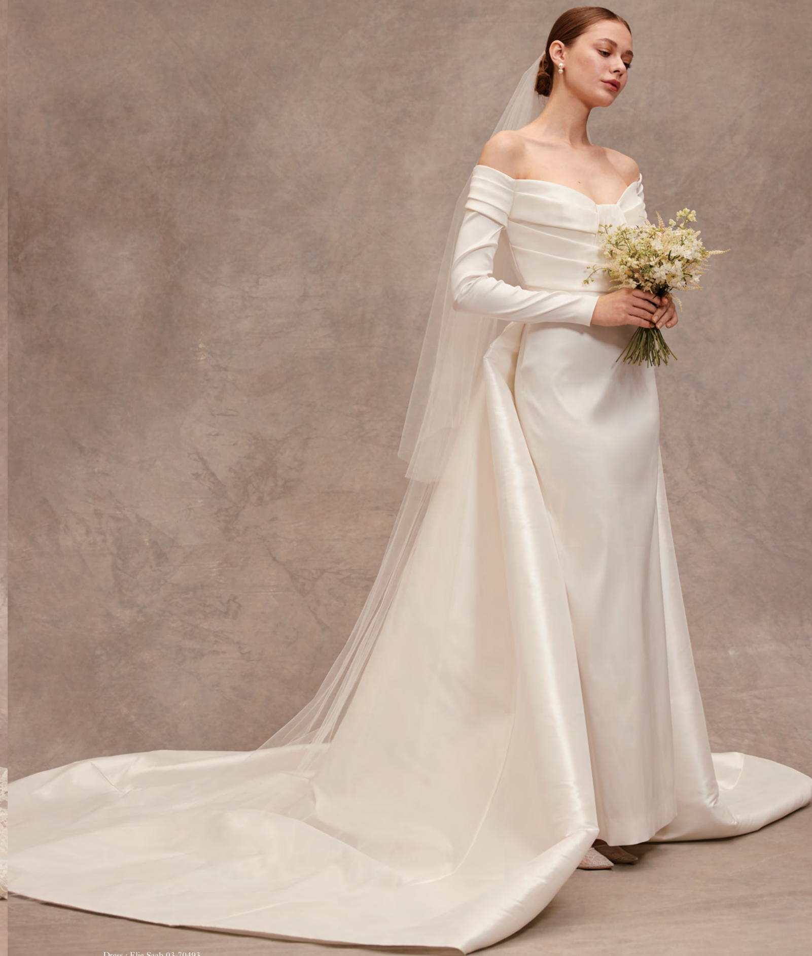
Dress : Elie Saab 03-70493 Earrings : Jennifer Behr 07-70217