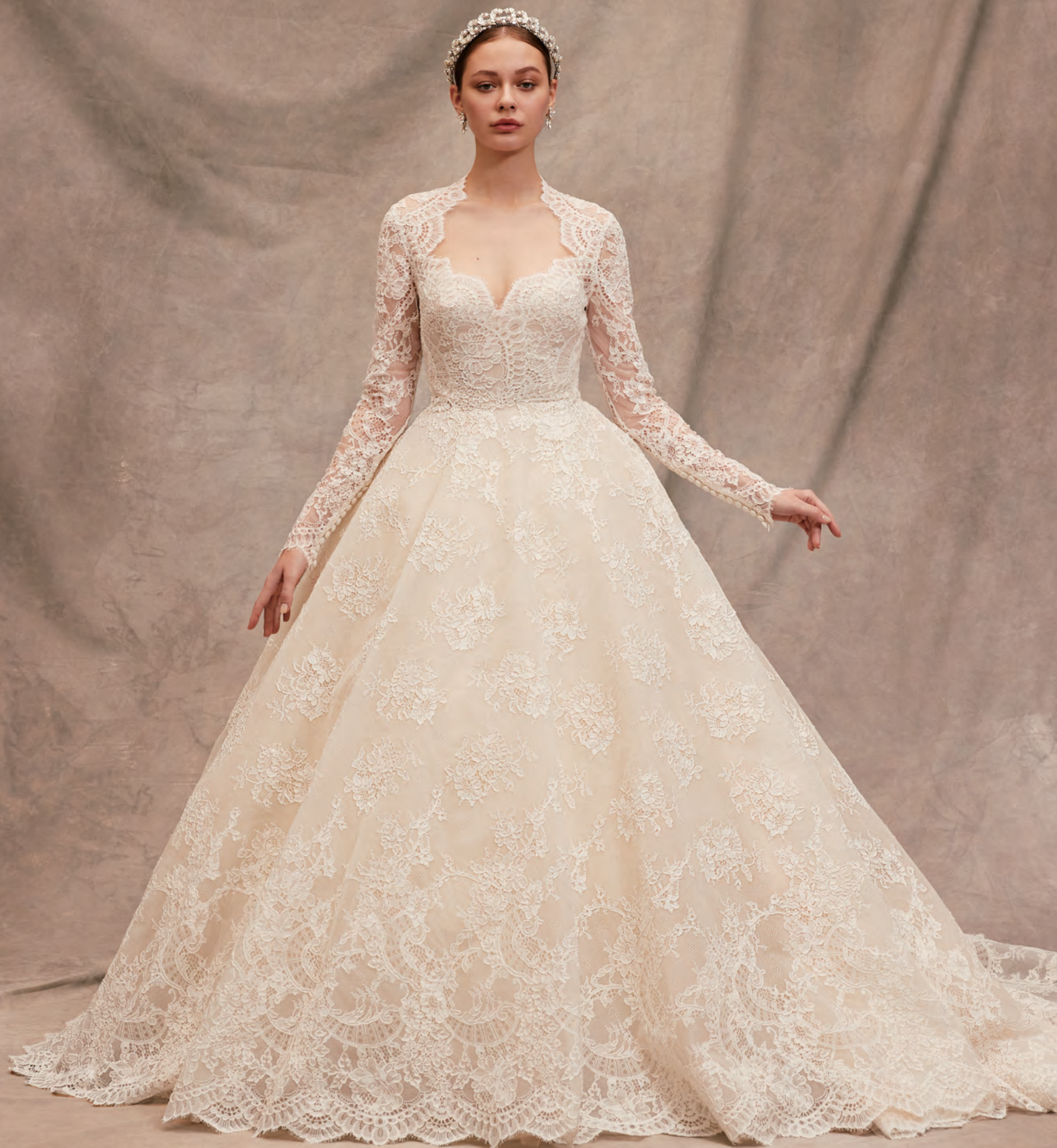
Dress : Elie Saab 03-70491 Tiara : Maria Elena 06-8233 Earrings : Paris by Debra Moreland 07-70210