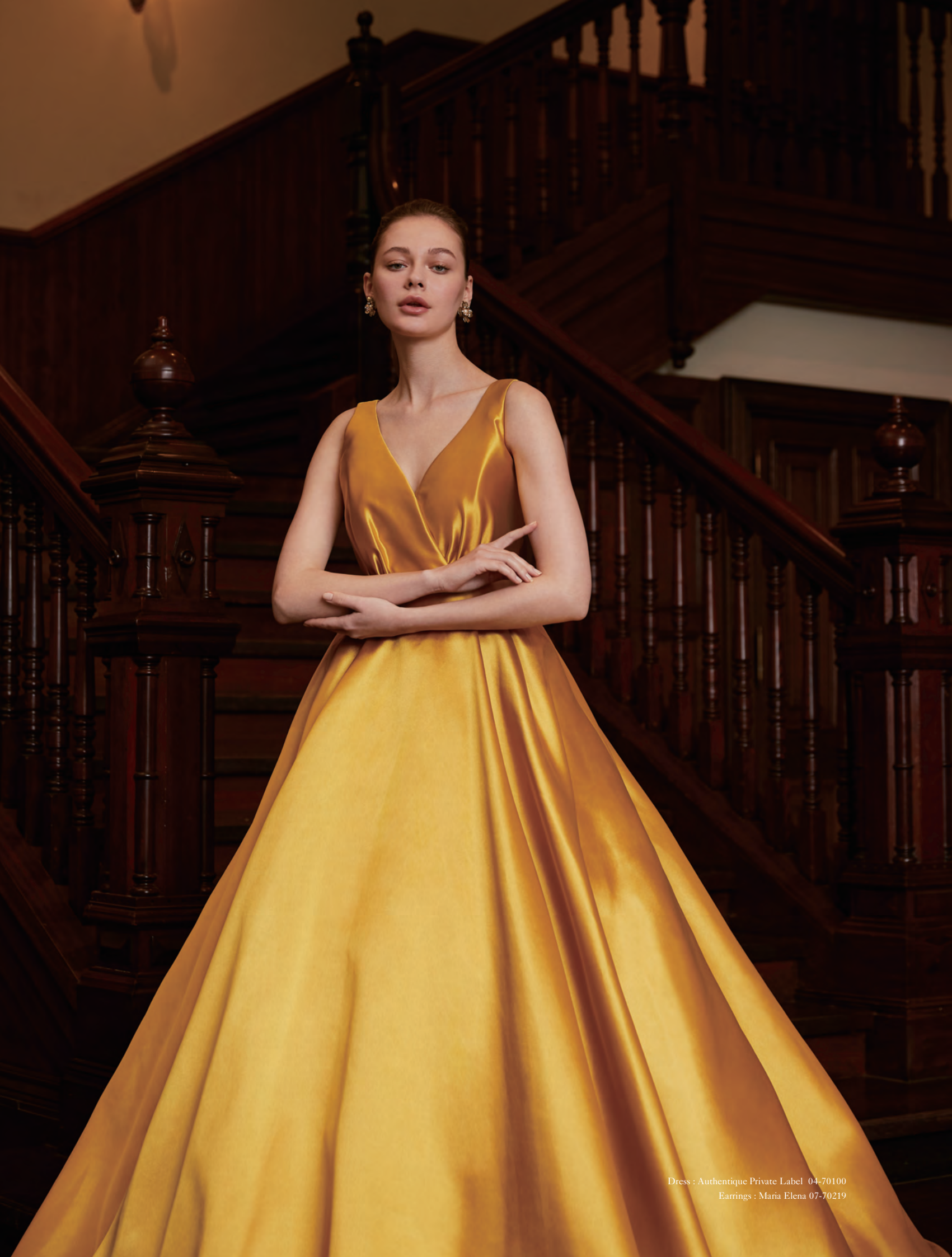
Dress : Authentique Private Label 04-70100 Earrings : Maria Elena 07-70219