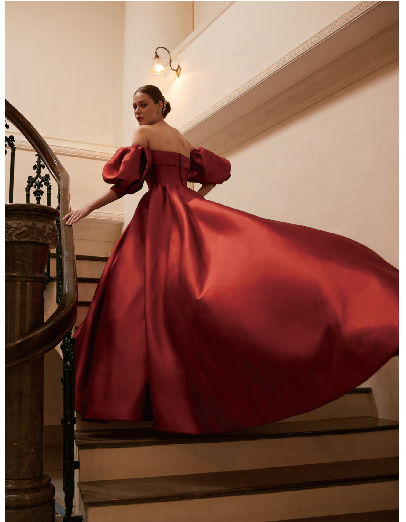
Dress : Authentique Private Label 04-70160 Head Accessory : Paris by Debra Moreland 05-70162 Earrings : Ben Amun 07-70194